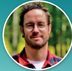
Sylvester Masmeijer Communicatie